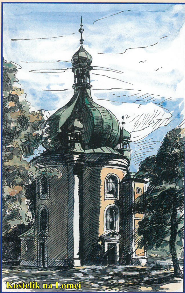
Kostelík na Lomci